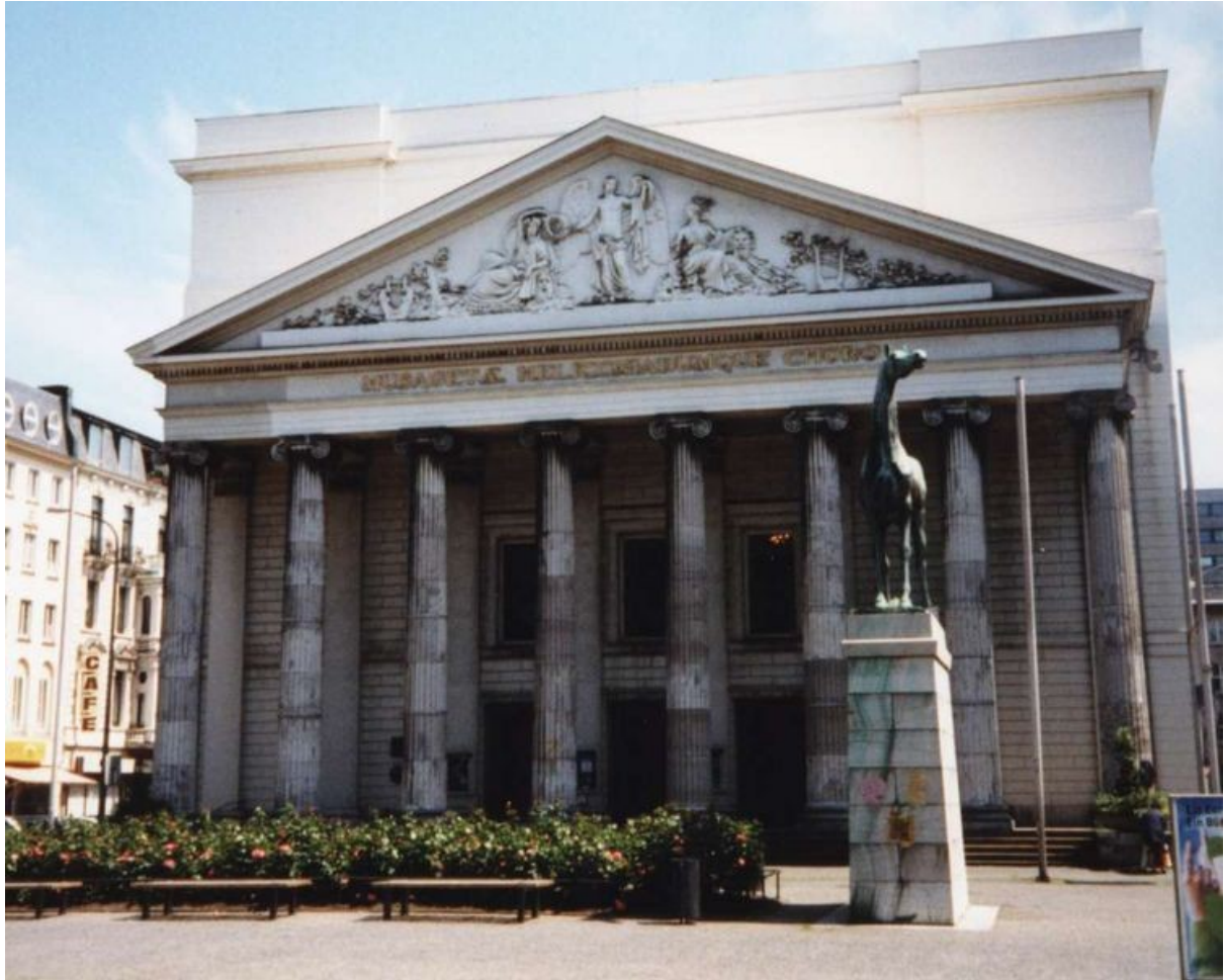
Théâtre d'Aix-la-Chapelle (1825)